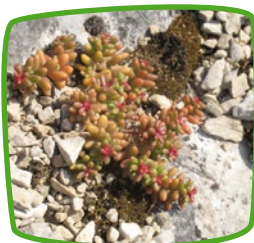
Orpins Pelouses calcaires

Certaines espèces végétales ne poussent que sur un milieu naturel.