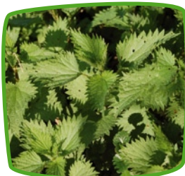
Orties Forêt, haies, prés, bords de cours d'eau