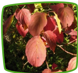
Cornouiller sanguin Forêts