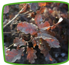
Chêne sessile Forêts