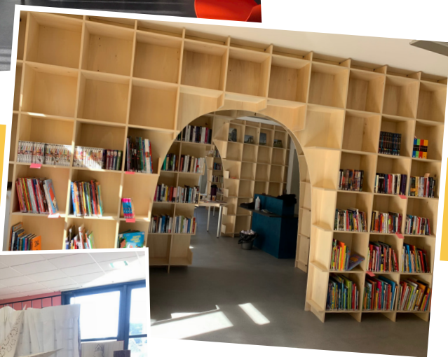
Bibliothèque de Grancey-le-Château