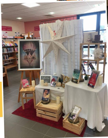
Médiathèque Henri Vincent Genlis