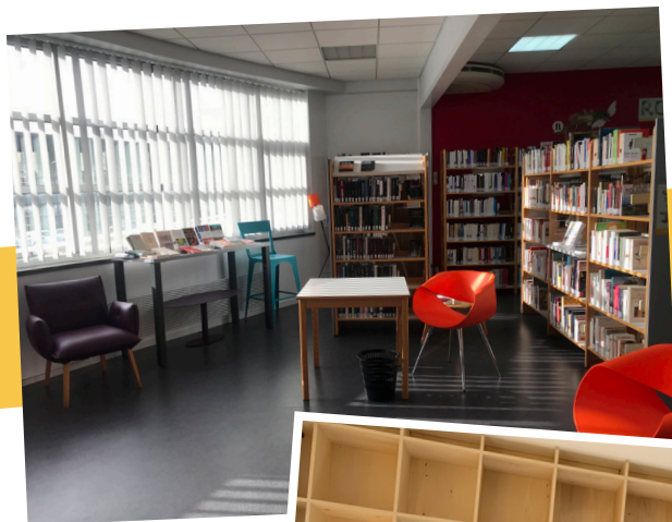
Médiathèque Jacques Prévert Montbard